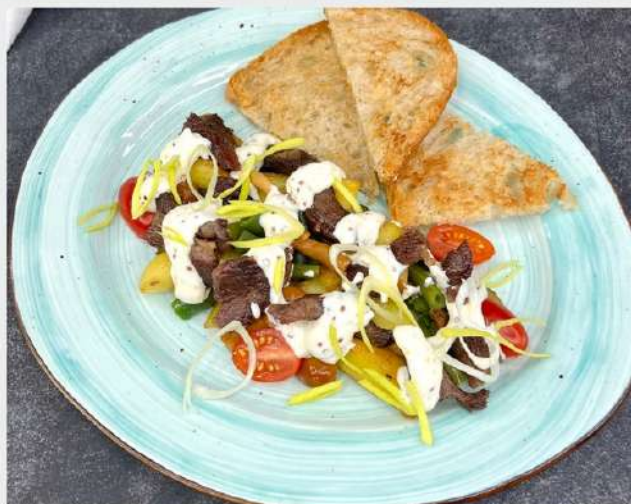
ТЁПЛЫЙ САЛАТ С ЩЁЧКАМИ, хрустящим картофелем и овощами