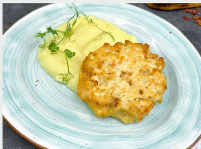
РУБЛЕНАЯ КУРИНАЯ КОТЛЕТА и картофельное пюре