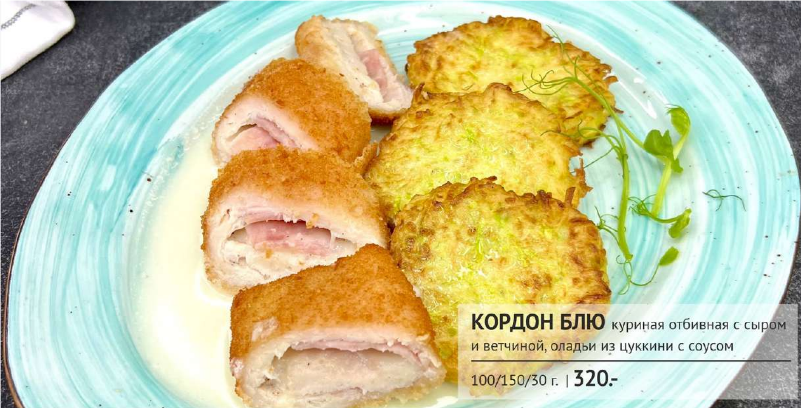
КОРДОН БЛЮ куриная отбивная с сыром и ветчиной, оладьи из цуккини с соусом