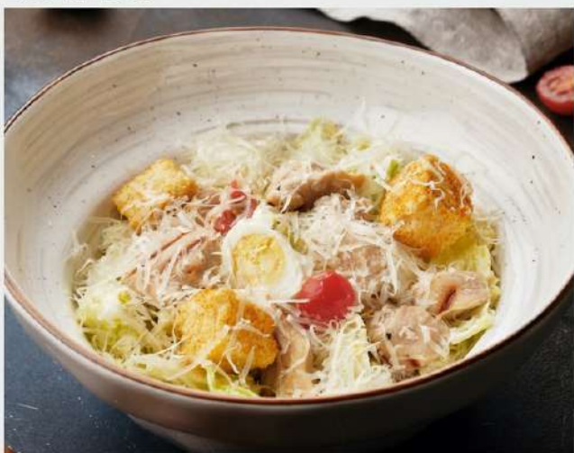
ЦЕЗАРЬ с цыплёнком, салатом Айсберг, Черри, сыром Пармезан, перепелиным яйцом