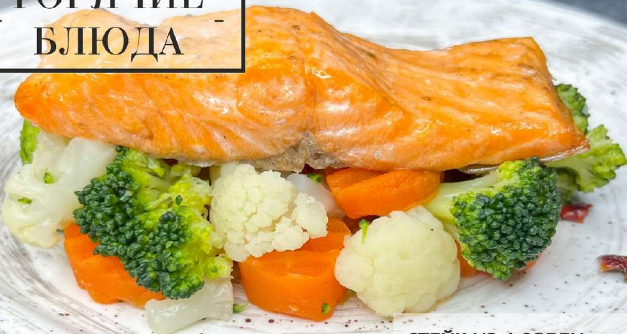
СТЕЙК ИЗ ФОРЕЛИ с овощами