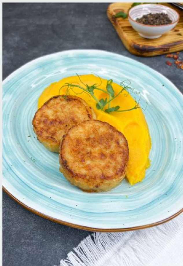
БИТОЧКИ ИЗ ИНДЕЙКИ