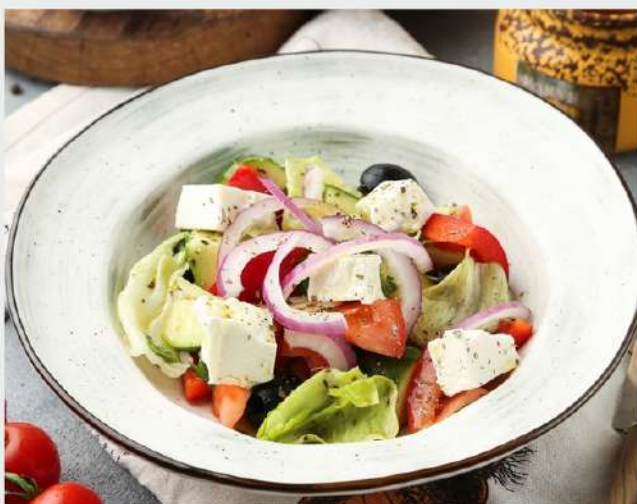
ГРЕЧЕСКИЙ свежие овощи с лимонной заправкой, фетой и красным луком.