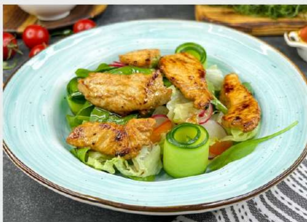
САЛАТ С ИНДЕЙКОЙ, шпинатом, салатом Айсберг, огурцом, редисом и перцем