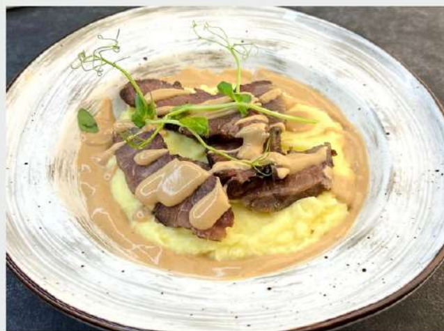
ЩЁЧКИ ГОВЯЖЬИ с картофельным пюре