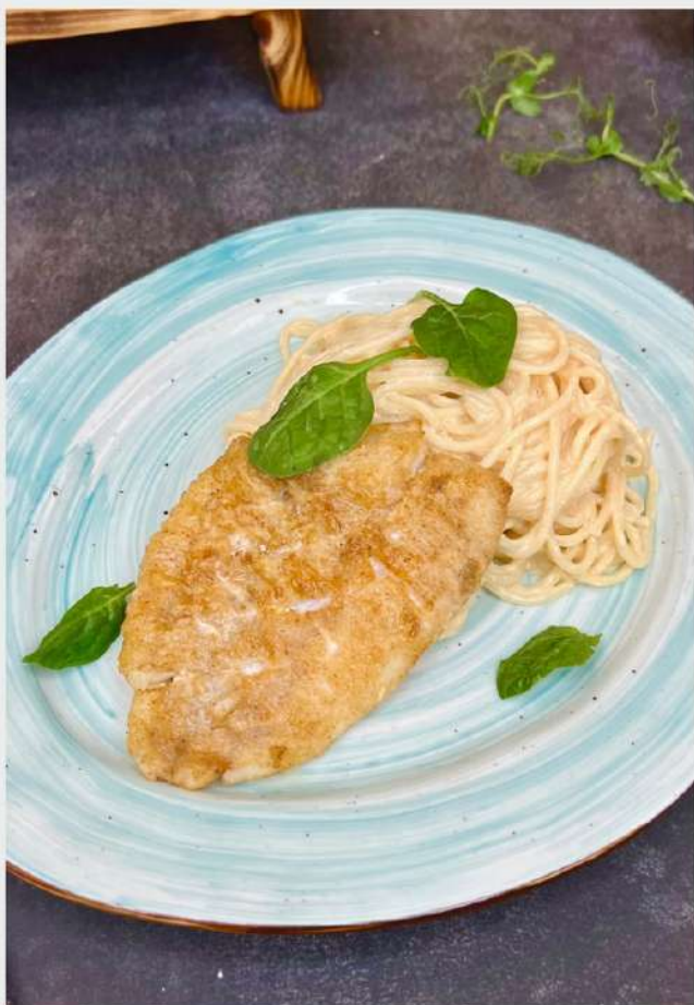
ФИЛЕ МОРСКОГО ОКУНЯ