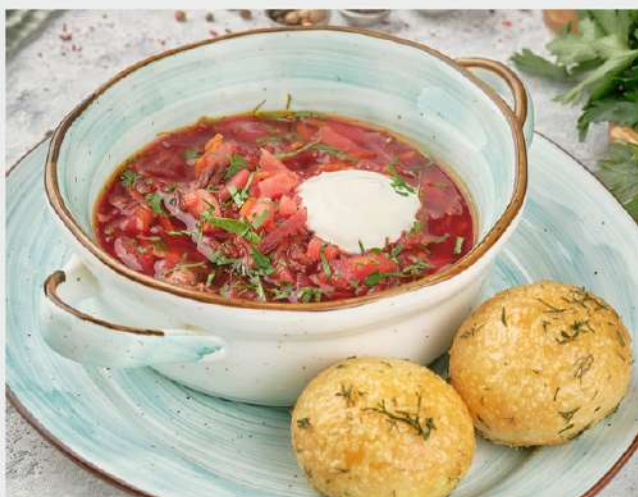
БОРЩ С ГОВЯДИНОЙ

ТОМ ЯМ с тигровыми креветками, кальмарами, печеными шампиньонами и томатами. Подаётся с отварным рисом 300 г. | 400.-