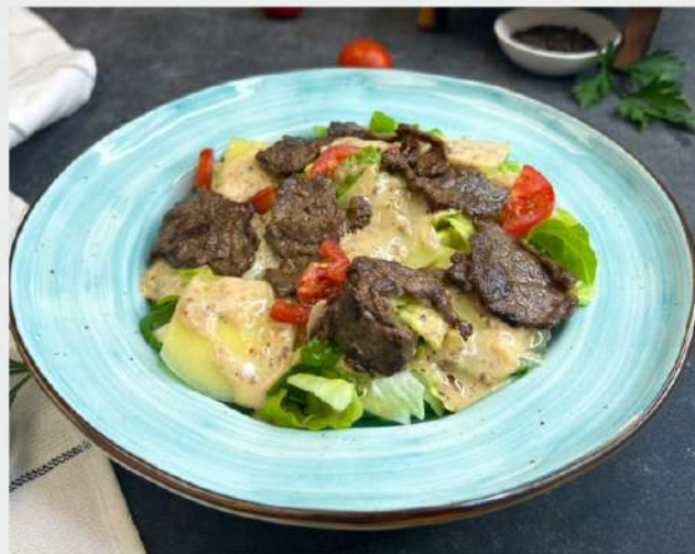
САЛАТ С ГОВЯДИНОЙ в ореховом соусе со свежими овощами и сыром Пармезан