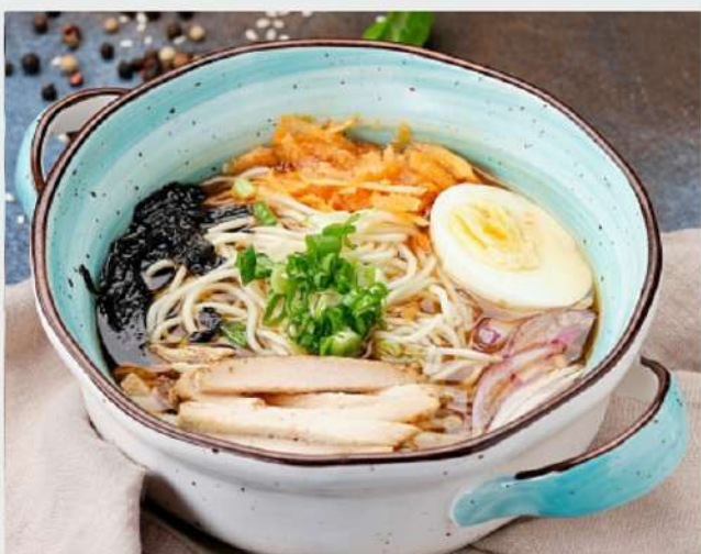
РАМЕН с куриным филе, яичной лапшой, водорослями нори, морковью и красным луком