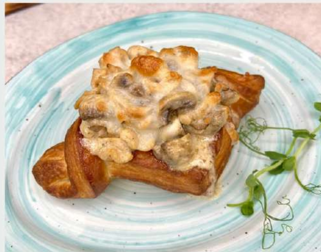
ЖУЛЬЕН с шампиньонами и курицей