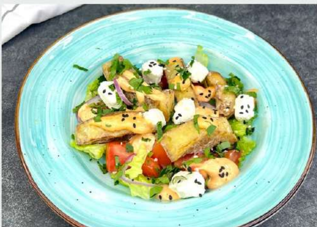
САЛАТ С ХРУСТЯЩИМИ БАКЛАЖАНАМИ, томатами, сыром и зеленью