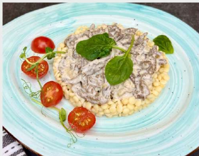
БЕФСТРОГАНОВ ИЗ ГОВЯДИНЫ с пастой Птитим