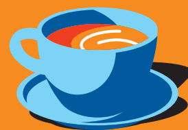
Раф «Васильки» 300 мл 430 ₽