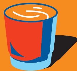
Латте «Алёнка» 300 мл 430 ₽