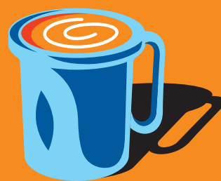
Латте «Золотой ключик» 300 мл 430 ₽