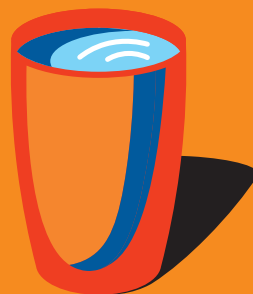
Латте «Рот Фронт» 300 мл 430 ₽